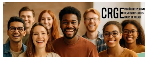
Enquête : Perception de la recherche et intérêt pour le doctorat chez les étudiants des écoles de la Conférence des Grandes Écoles Hauts-de-France