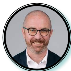
Président Jérôme FORTIN